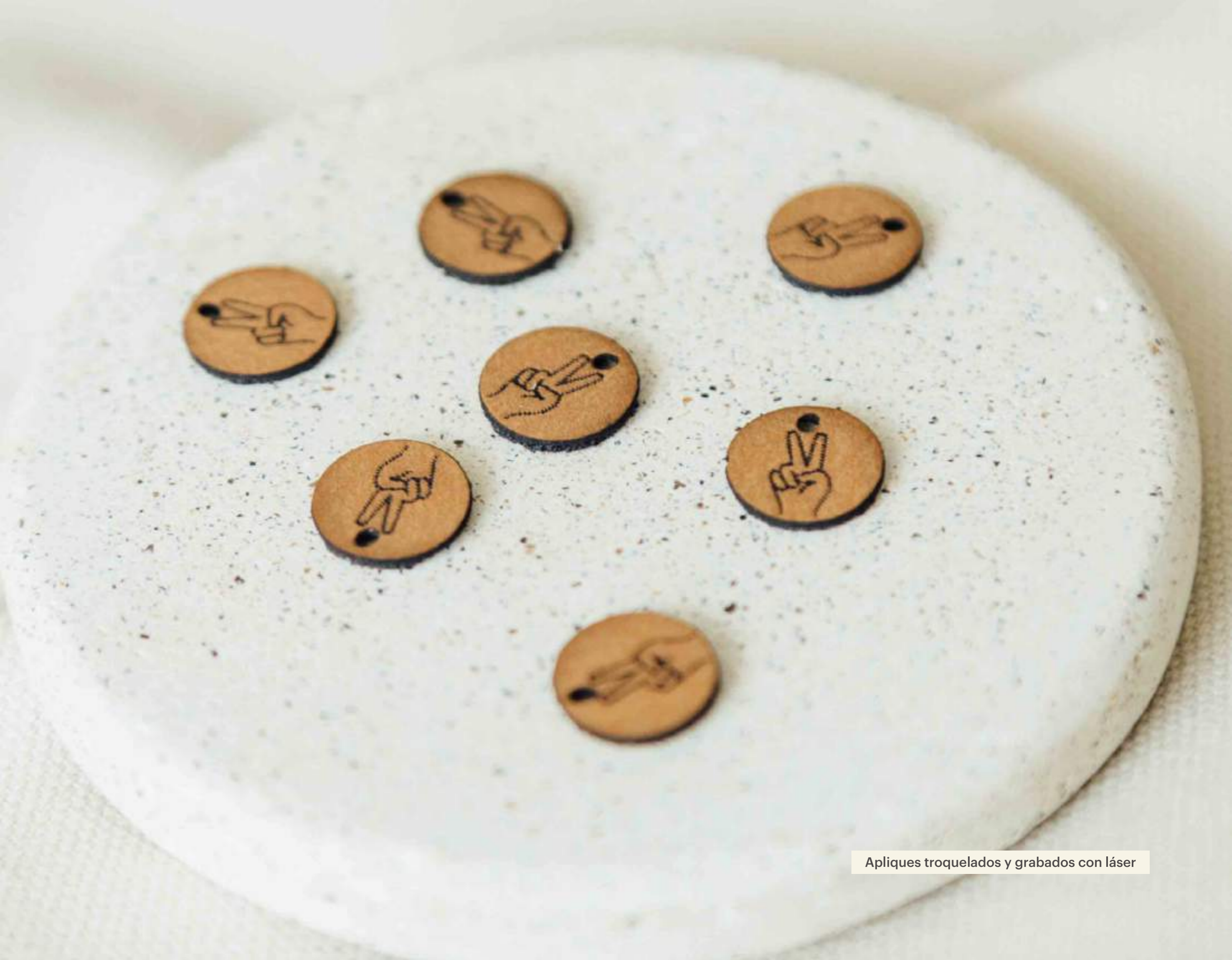
Appliques troquelados y grabados con láser